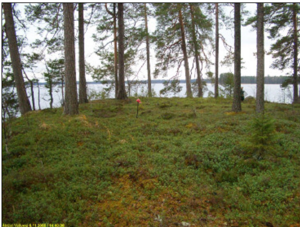
Asuinpaikan aluetta niemen kärkinipukassa. Löydöt kuvassa olevan lapion kohdalta ja ympäristöstä. Kuvattu etelään.