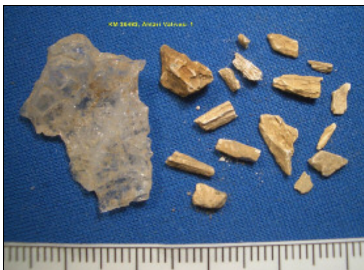
Vasemmalla kvartsi-iskos, oikealla palaneen luun muruja.

Huomiot: Mäenrinteen eteläpäässä veteen laskeva rinne loivenee ja rannan tuntumassa on tasaisempi vain hieman järveen viettävä terassi n. 2 m vedentason yläpuolella. Maaperä alueella on yleisesti hyvin kivinen hiekkamoreeni, mutta tällä kohdalla vähemmän kivinen. Paikalle tehdyssä koekuopassa oli runsaasti pienen pientä palaneen luun murusta ja likamaata n. 20 cm syvyyteen. Paikka on ilmeisesti varsin suppea. Lähistölle tehdyistä muista koekuopista ei saatu esiin löytöjä. Paikka on ehjä ja kajoamaton. Sen rajaus on topografian perusteella tehty arvio.