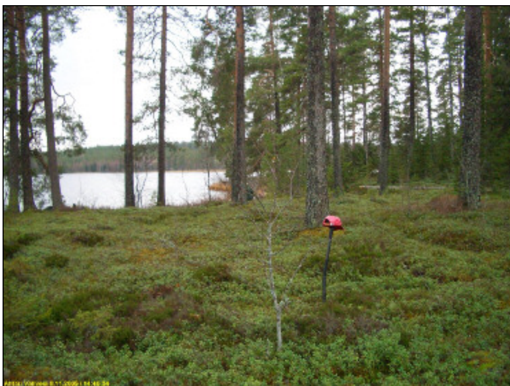
Asuinpaikan aluetta kuvattuna länteen. Taustalla matala lahdeke, jonka rantavedestä löytyi pari pyöristynyttä iskosta.