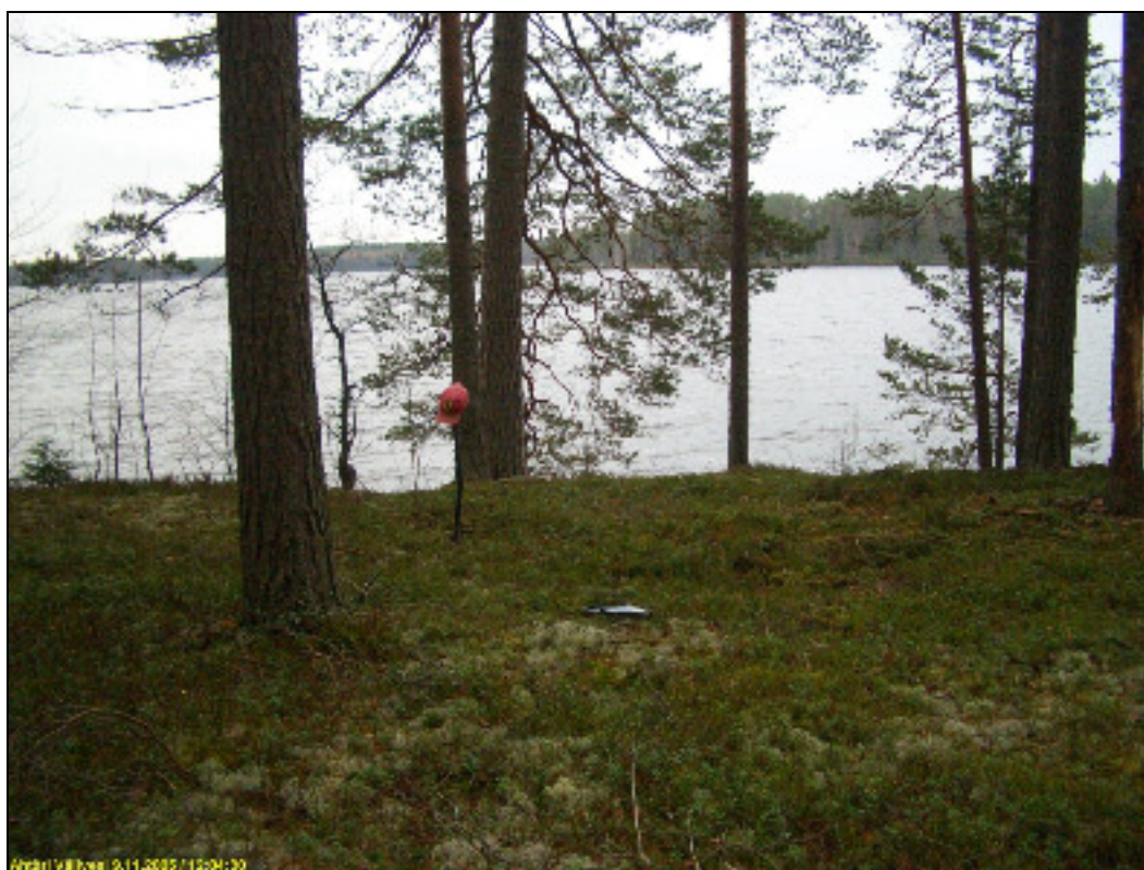
Asuinpaikka ja löytökohta. Kuvattu lounaaseen. Taustalla, järven vastarannalla on kuvan keskellä Hauinnimen kärki, jossa myös kivikautinen asuinpaikka.