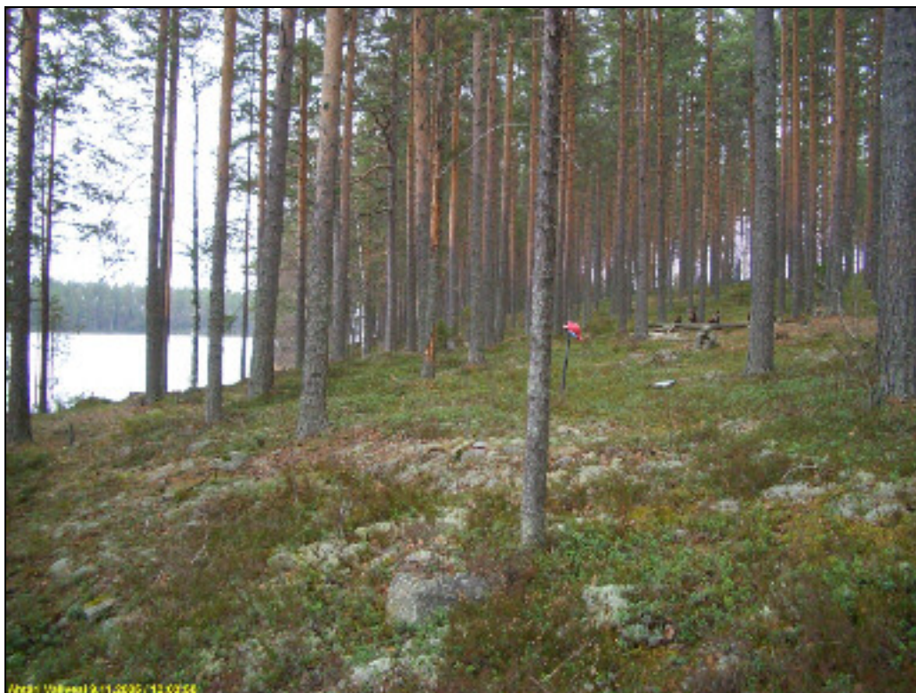
Asuinpaikan maastoa. Löydöt lapion kohdalta. Taustalla oikealla nykyinen nuotiopaikka. Kuvattu pohjoiseen