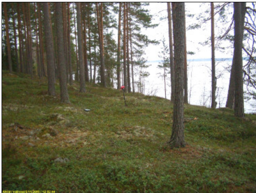
Asuinpaikan maastoa. Löydöt lapion kohdalta. Kuvattu etelään.