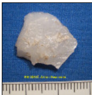
Yllä: kvartsikaavin. Oik: kvartsi-iskoksia.

Kärkinipukan länsipuoleiselta hiekkarannalta, rantavedestä, löytyi pari hieman pyöristynyttä iskosta. On mahdollista, että paikalla on veden alle jäänyt asuinpaikka, josta nyt ei saatu tarkempia havaintoja järven veden ollessa lähes korkeimmillaan.