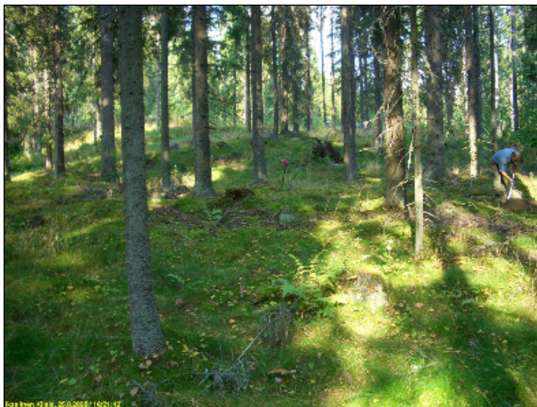
Asuinpaikan maastoa kuvattuna muinaisrantatörmän juurelta pohjoiseen.