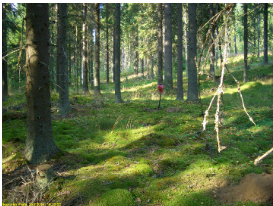
Asuinpaikan maastoa kuvattuna muinaisrantatörmältä länsi-luoteeseen