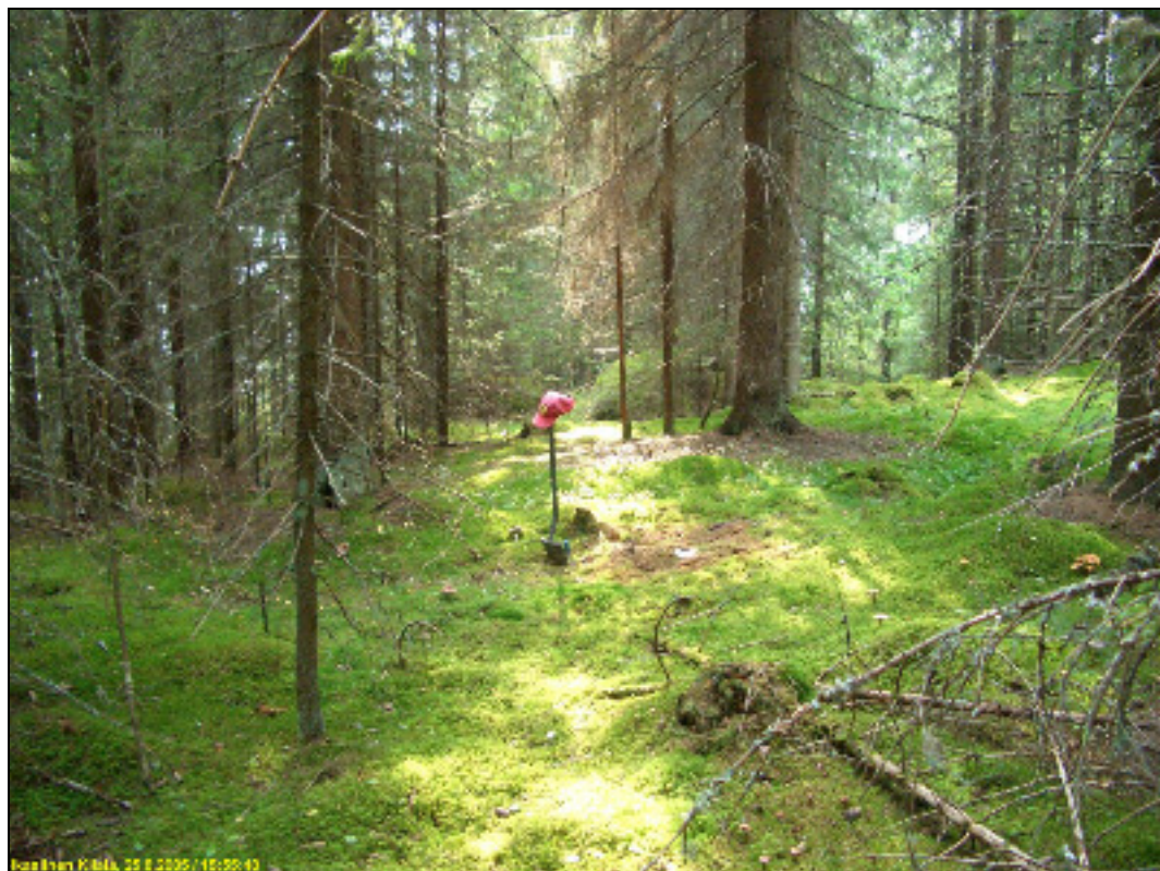
Asuinpaikan maastoa kuvattuna lounaaseen, rannan suuntaan.