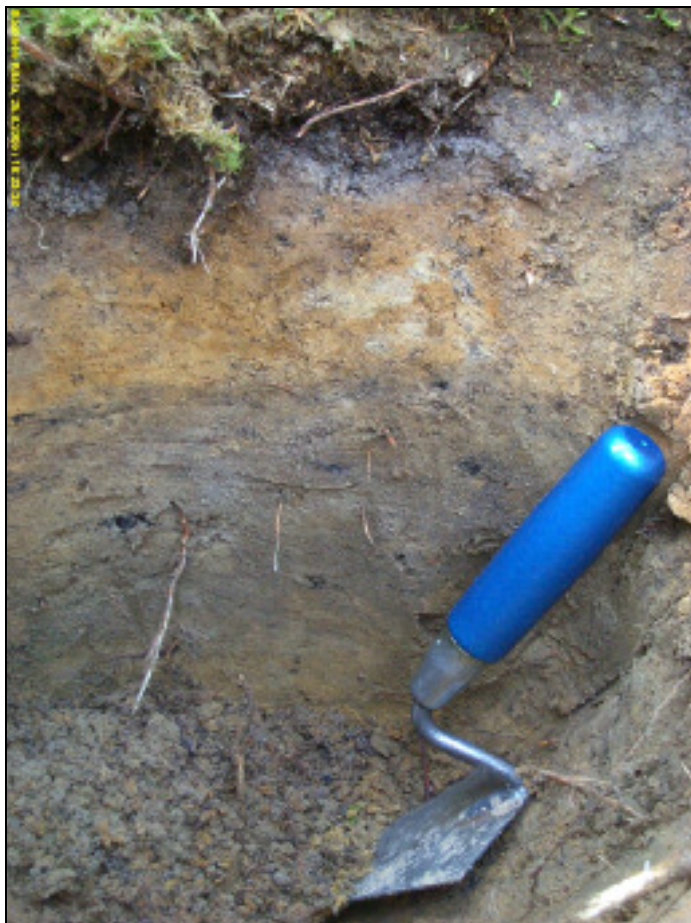
Mahdollista kulttuurikerrosta koekuopassa.