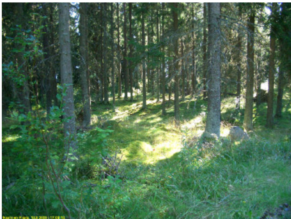
Asuinpaikka rinteen juurella olevalla tasanteella. Kuvattu rinteen laelta, tien varrelta, etelään.