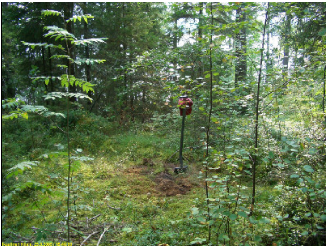
Asuinpaikan maastoa kuvattuna etelään rannan suuntaan.