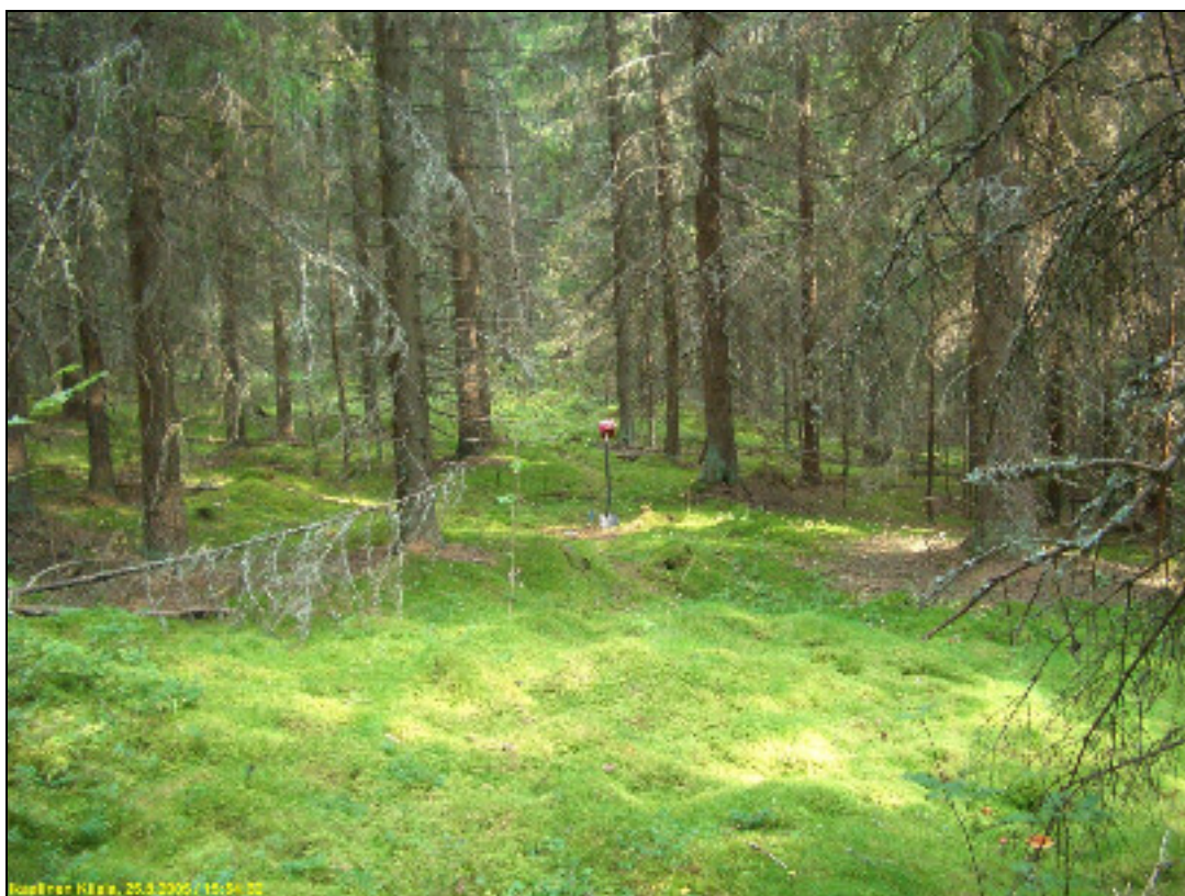
Asuinpaikan maastoa kuvattuna itään.