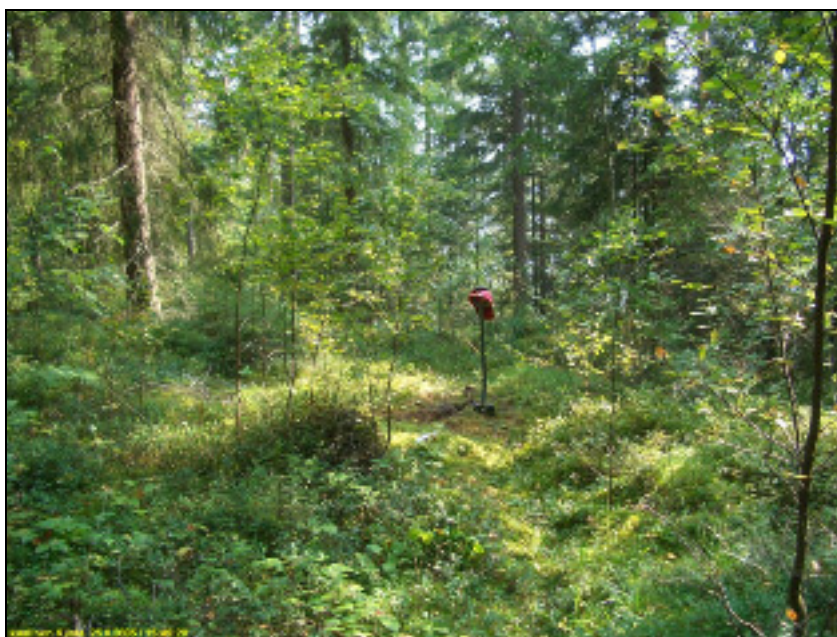
Asuinpaikan maastoa kuvattuna kaakkoon.

Huomiot: Rantaan laskevan jyrkähkön rinteen laella on tasanne, joka edelleen laskee paikan kohdalla hieman myös itään. Asuinpaikkatasanteen pohjoispuolella on myös pieni nousu. Maaperä paikalla on hienohiekkainen moreeni, suhteellisen vähäkivinen, kasvillisuus sekametsää. Löydöt tulivat yhdestä koekuopasta. Sen lähistölle tehdystä viidestä muusta koekuopasta ei saatu löytöjä. Korkeuden perusteella, 88-89 m mpy., paikka lienee varhaismetallikautinen. Tuon aikakauden paikoilla löydöt ovat usein hyvin keskittyneitä, jolloin löytökohtiin osuminen satunnaisessa koekuopituksessa on onnen varassa. Asuinpaikka on täysin ehjä ja kajoamaton, Asuinpaikan rajausta on karkea arvio, löytökohdasta parikymmentä metriä rannan suuntaisesti kumpaankin suuntaan. Asuinpaikan tarkka rajaaminen edellyttää koekaivauksen.