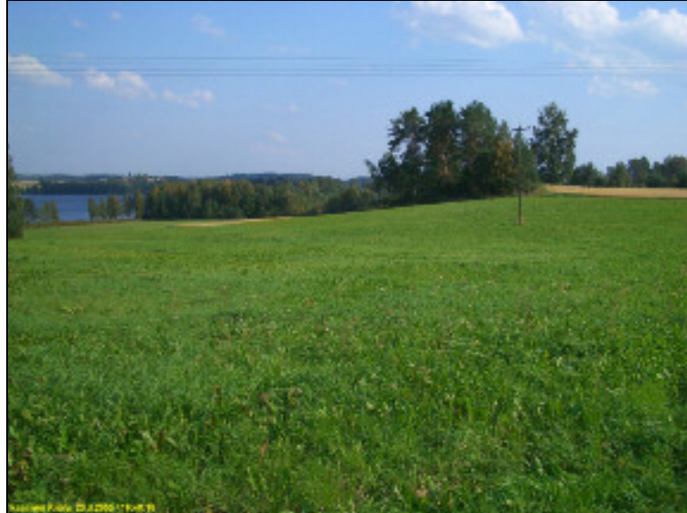
Maisema tieltä Pietilän pohjoispuolelta itä-kaakkoon

Lakkamaan ja Pakurinnimen välillä on korkea ja jyrkkä Kyrösjärven laskua edeltävän rannan hiekkainen törmä. Paikoin törmä n laki nousi lähes 90 m tasolle, ollen suurimmalta osin n. 85-86 m korkeudella. Laki on ollut kuivilla varhaismetallikaudelta lähtien. Maasto törmän takana on kuitenkin melko tasaista. Huolimatta kohtalaisen tiheästä koekuopituksesta ei tältä muinaisrannalta löydetty mitään esihistoriaan viittaavaa. Etelärannalla oli monoin paikoin näkyvissä vanhaan rantatörmään koverrettuja hiekanottoaikoja.