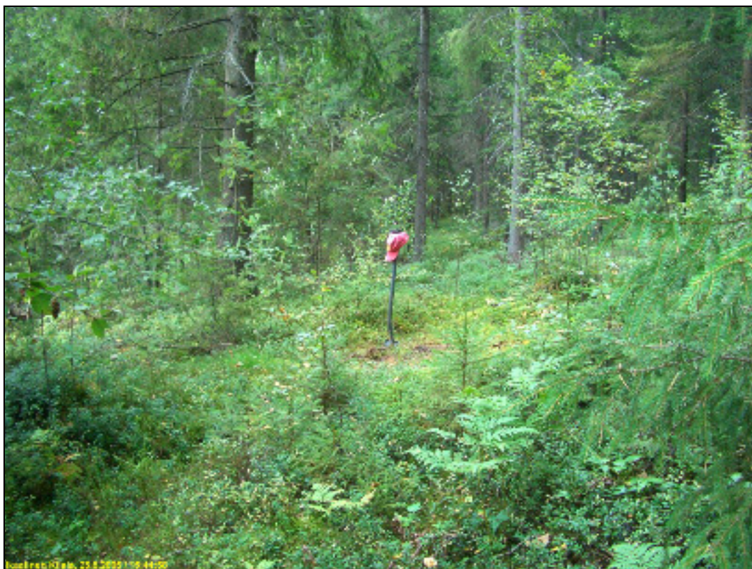
Asuinpaikan maastoa kuvattuna länteen.