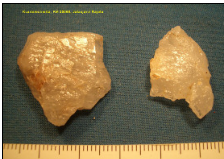
Kvartsi-iskoksia Rajalan pellostä

Kvartsiesineitä Rajalan pellostä. Vas. puoleisen esineen kovera terä sen vasemmassa reunassa, oikeanpuoleinen on kaapimen katkelma jonka terä myös kuvassa oikealla.