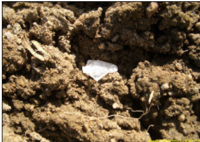
Kvartsi-iskos "in situ" Rajalan pellossa

Huomiot: Rajalan talon eteläpuoliselta peltorinteeltä löytyi harvakseltaan kvartseja. Maaperä paikalla on moreeni, ylempänä hiekkainen alempana peltorinteessä hiesuisempi. Kvartsien keskittymä vaikutti painottuvan n. 30 m pellon reunasta etelä-kaakkoon. Peltorinteen laelta löytyi vain yksi kvartsi. Löydettyjen kvartsien joukossa on yksi kvartsiesine ja yksi esineen katkelma. Talon itäpuoliselta pellolta, kymmenisen metriä pellon reunasta itään, alarinteeseen löytyi muutama kvartsi. Peltorinteen yläpuolella ja Rajalan pohjoispuolella olevalla tasaisella lakipellolla ei havaittu merkkejä esihistoriasta. On ilmeistä, että asuinpaikka ulottuu Rajalan eteläpuolelta sen itäpuoliselle peltorinteelle. Asuinpaikka on siis sijainnut muinaisessa niemekkeessä. Asuinpaikan kartalle merkitty rajausarvio sisältää suoja-alueen ja se perustuu löytöjen levintään, sekä paikan topografiaan. Havainto-olosuhteet kuivassa, avoimessa pellossa olivat tyydyttävät.