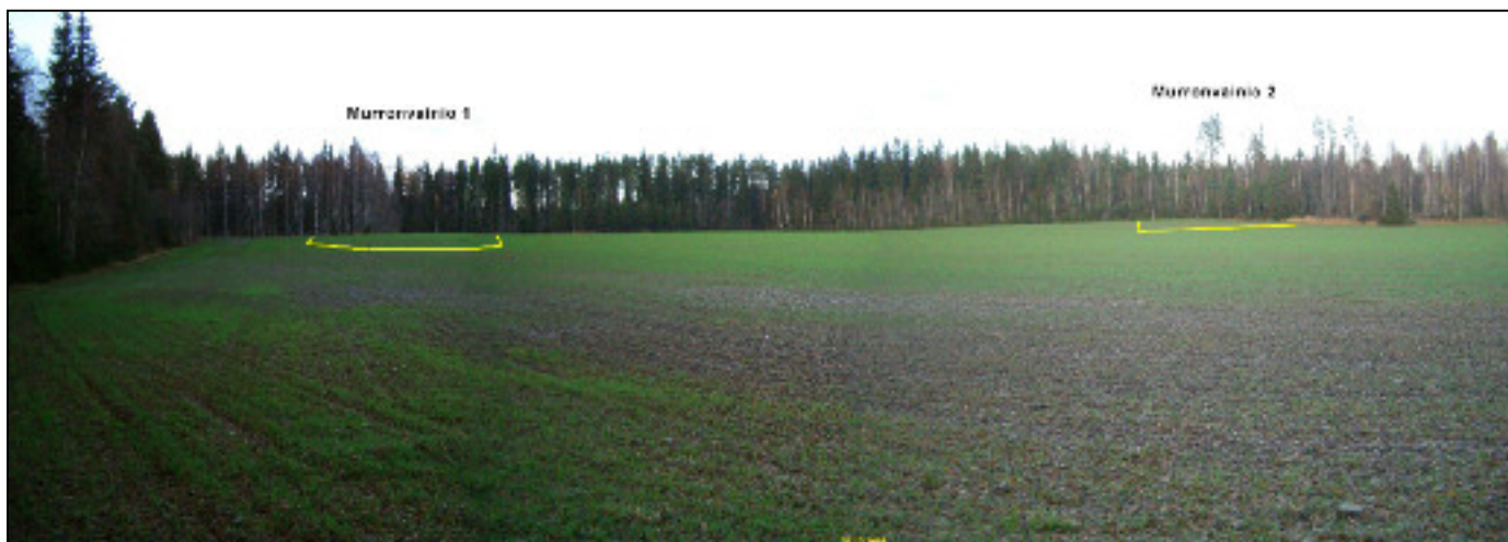
Panoraama kuva pohjoiseen. Asuinpaikat merkitty kuvaan keltaisella viivalla.