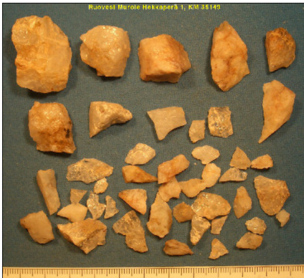
Asuinpaikalta löytyneitä kvartsi-iskoksia ja -ytimiä.