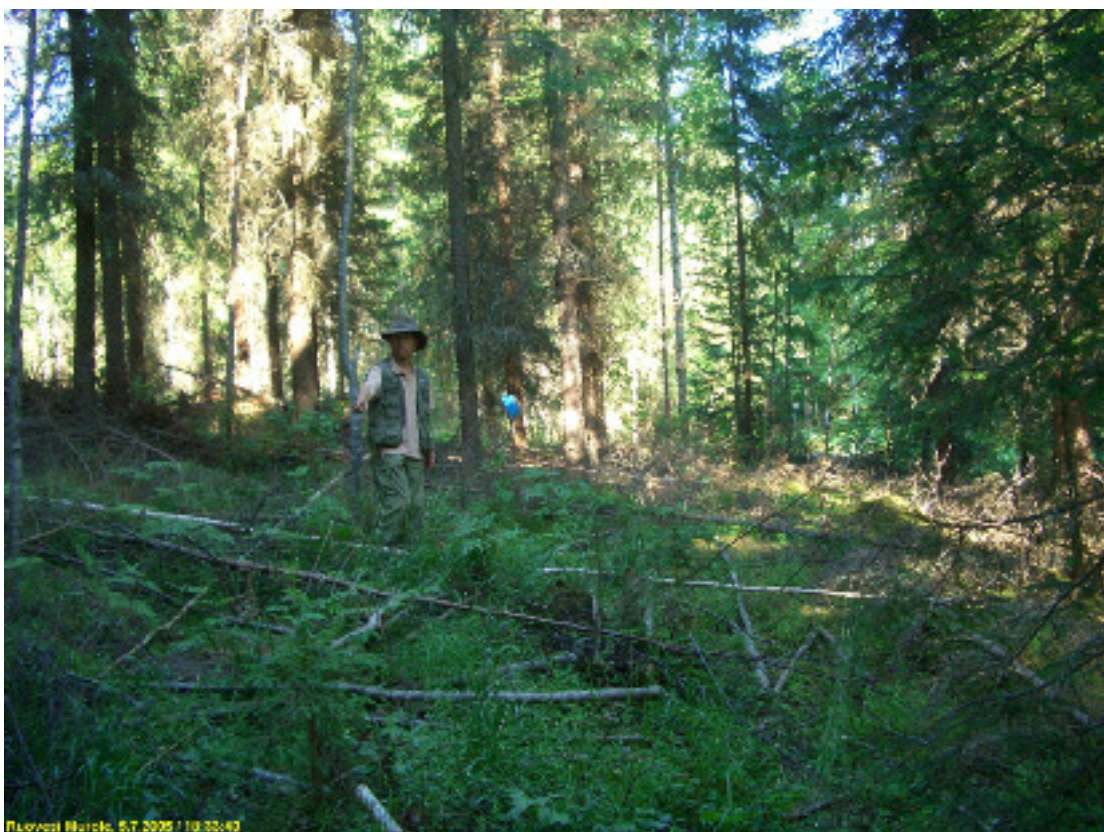
Asuinpaikan maastoa kuvattuna itään.