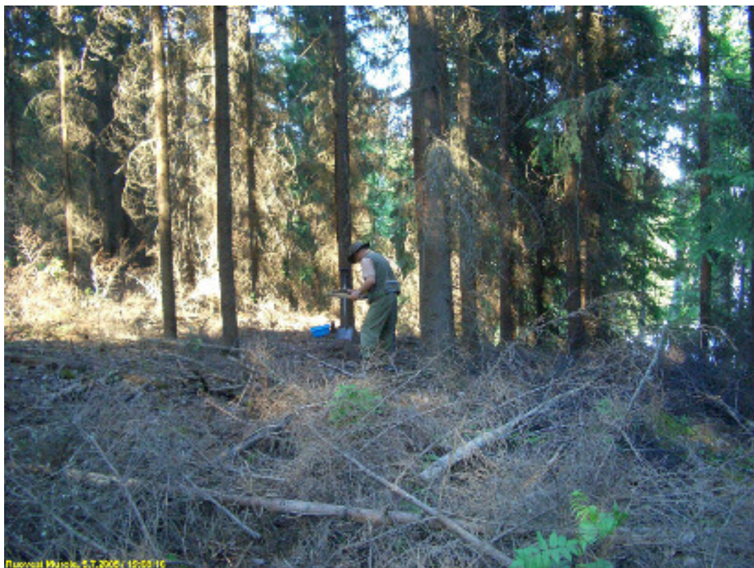
Asuinpaikka kuvattuna itään.