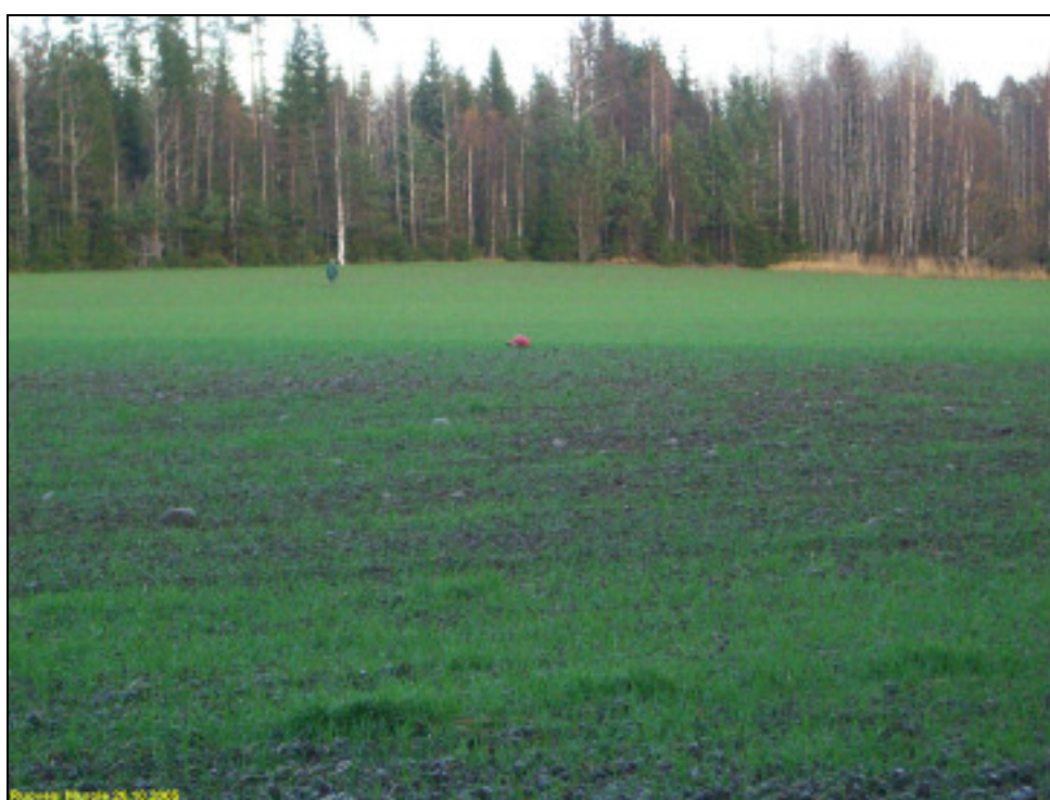
Asuinpaikan maastoa kuvan etualalla, kuvattu itään kohti Murrenvainio 2 asuinpaikkaa.

Löytöjä. Vasemmalla kvartsiydin, oikealla iskoksia