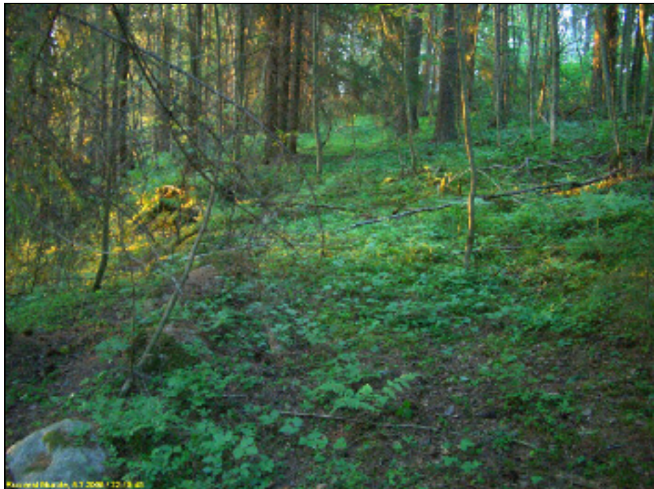
Vanha tieura rinteessä kuvattu pohjoiseen.