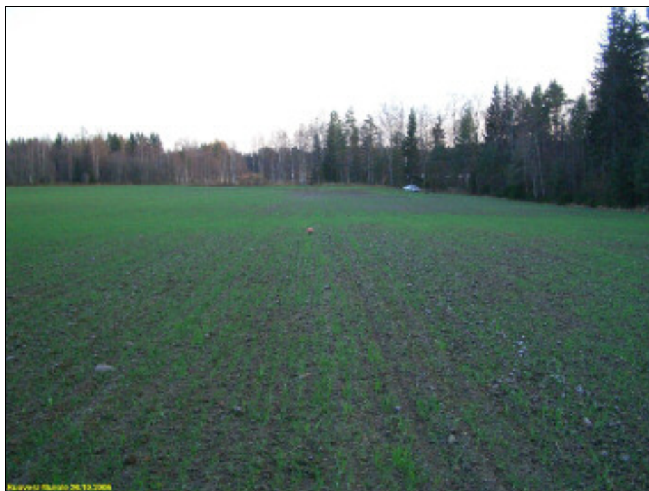
Asuinpaikkaa pellossa kuvan etualalla. Kuvattu etelään.

Paikka on muinaismuistolailta suojeltu 2. luokan muinaisjäännös. Paikka on merkittävä kaavaan vähintään oheisen kartan rajauksen mukaisesti SM-alueena.