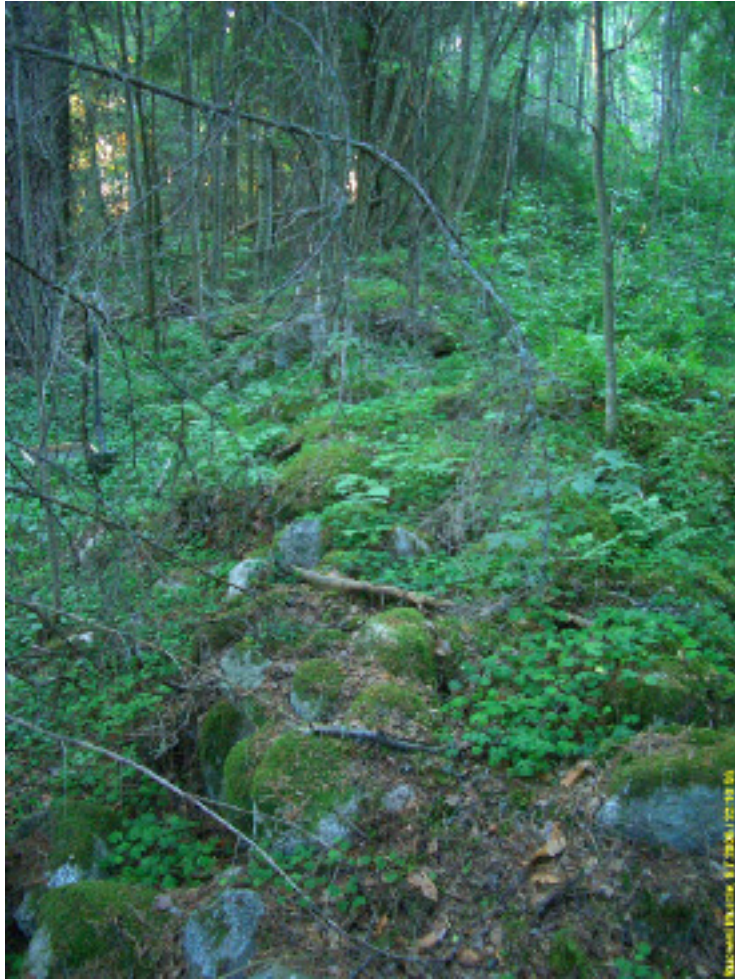
Kiviaidan eteläpäätä kuvattuna pohjoiseen.