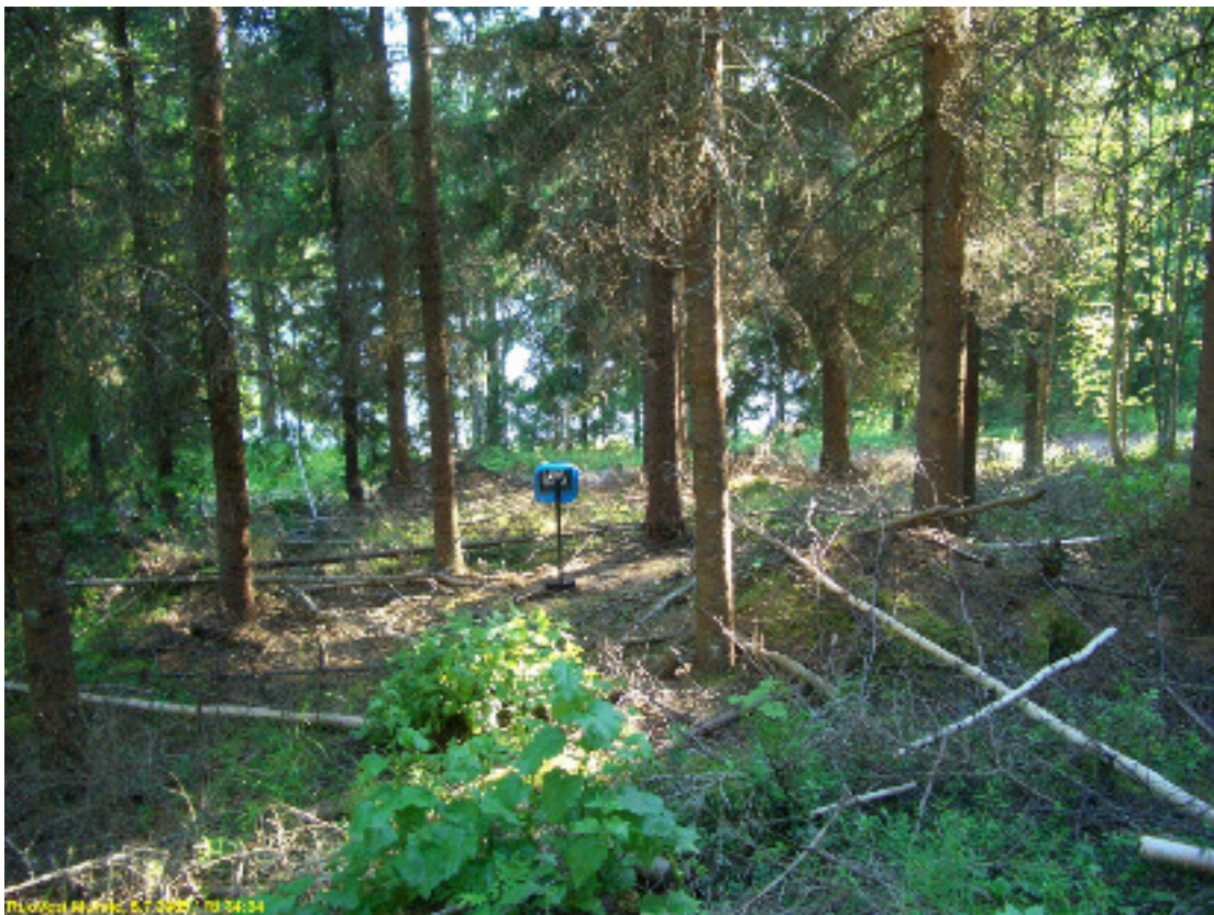
Asuinpaikan maastoa kuvattuna etelään.