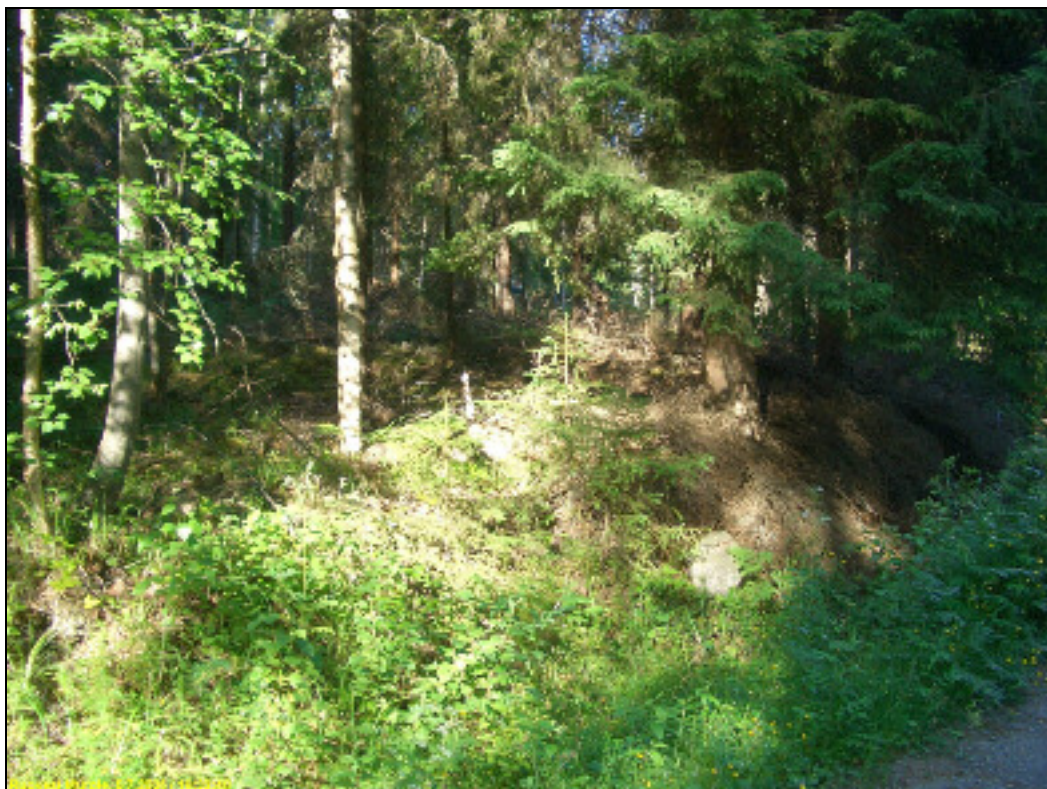
Kuvattu tieltä koilliseen, asuinpaikka törmän päällä metsässä.