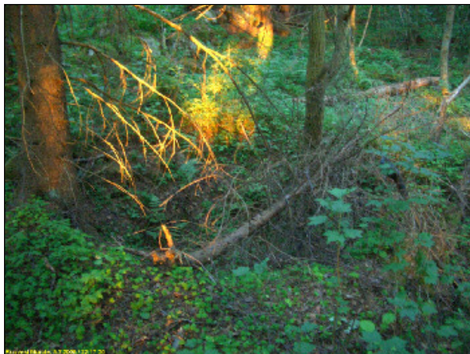
Maakellarin jäänteet. Alla oviaukon kohta, kuvattu itään.