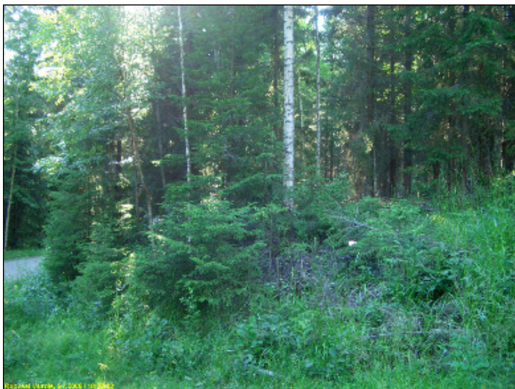
Kuvattu "laaksosta" länteen, asuinpaikka ylätasanteella metsässä.