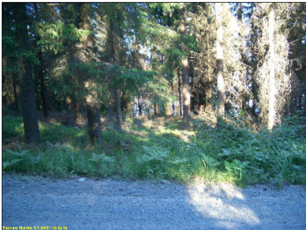
Asuinpaikkatasannetta kuvattuna tieltä kaakkoon.