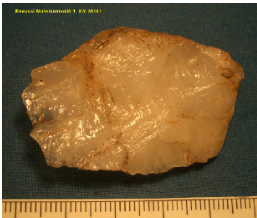
Paikalta löytynyt kvartsiveitsi. Alareunassa retusoitua terää. Alla sama esine toiselta puolelta, terä ylhäällä.