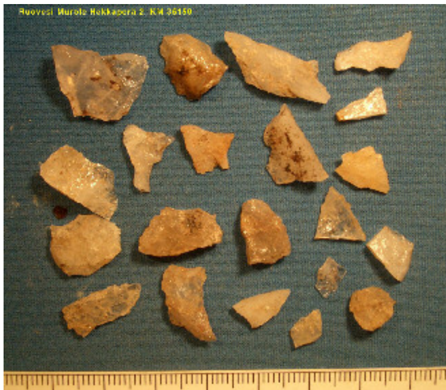
Asuinpaikalta löytyneitä kvartsi-iskoksia