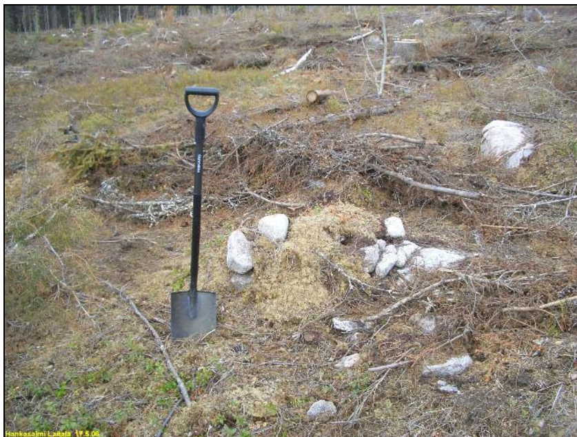
Pienen kiviraunion jäännökset: kaskiraunio tms. Alla: kuvan keskellä sortuneen kellarikuopan jäännökset. Iso kanto on kuopan yläkulmassa. Siitä päätellen kuoppa on 1800-luvun lopulta – 1900 luvun alkupuoliskolta.