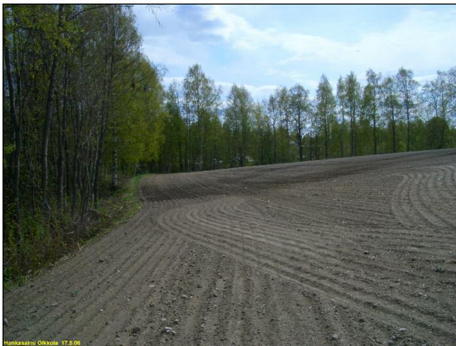
Kärjen itärantaa kärkialueen asuinpaikan osan pohjoisimman kvartsilöydön tasalta etelään.