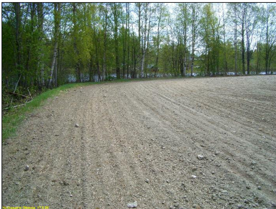
Niemen kärkinipukan itärantaa. Kivikautisia asuinpaikkalöytöjä koko kuvan alalta. Alla: Niemen kärki kuvattuna kauempaa etelään.