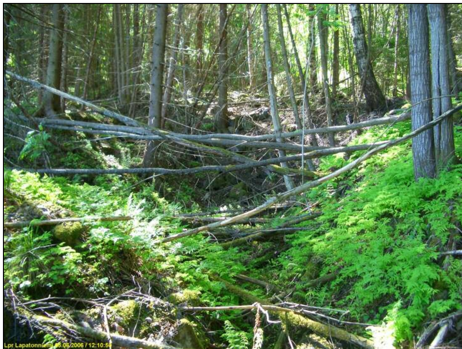
Mahdollisesti vanhan korsun jäännökset tai maanottokaivanto.