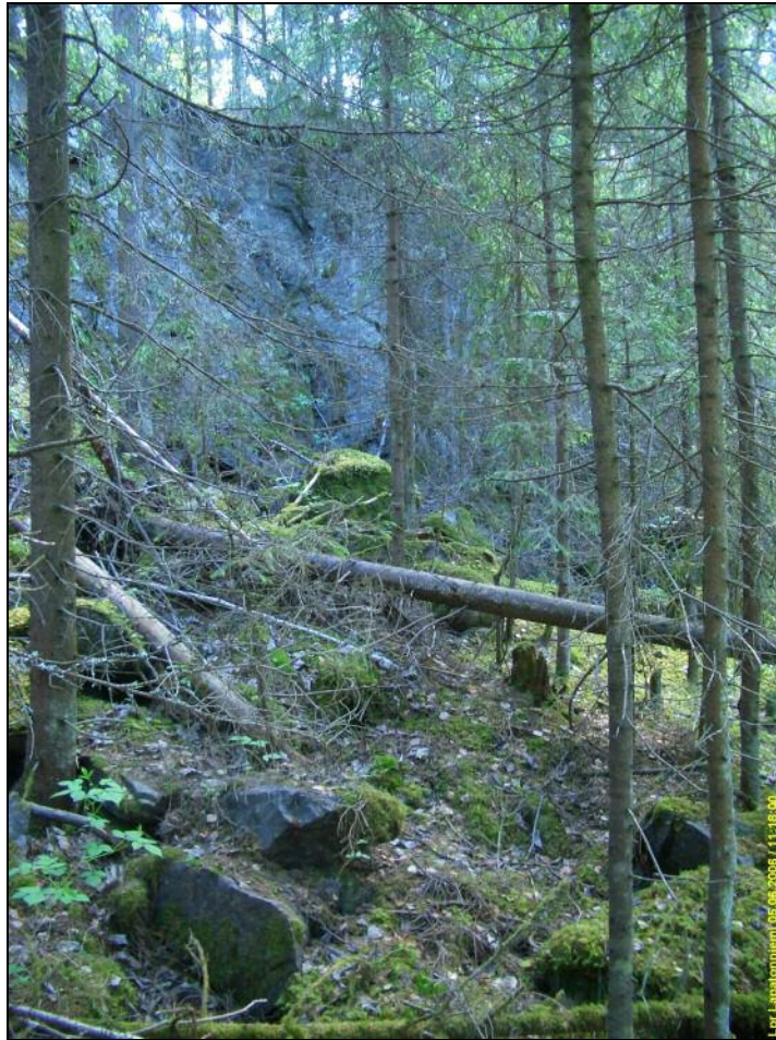
Kivilouhos Rutolan sillan koillispuolella.