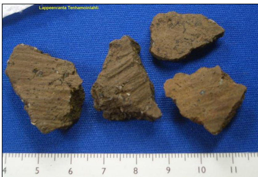
Paikalta löytyneitä saviastian palasia. Alla yläkuva kahden vas. puoleisen palan sisäpuolet.