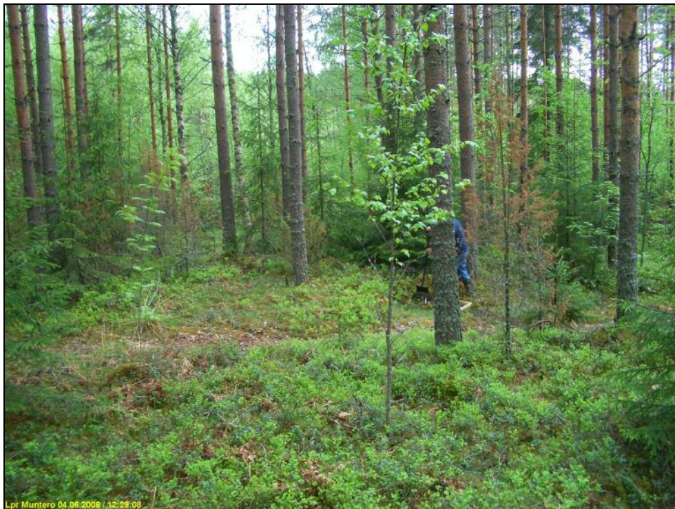
Tenhamoinlahden asuinpaikkaa kuvan alalla. Kuvattu lounaaseen.