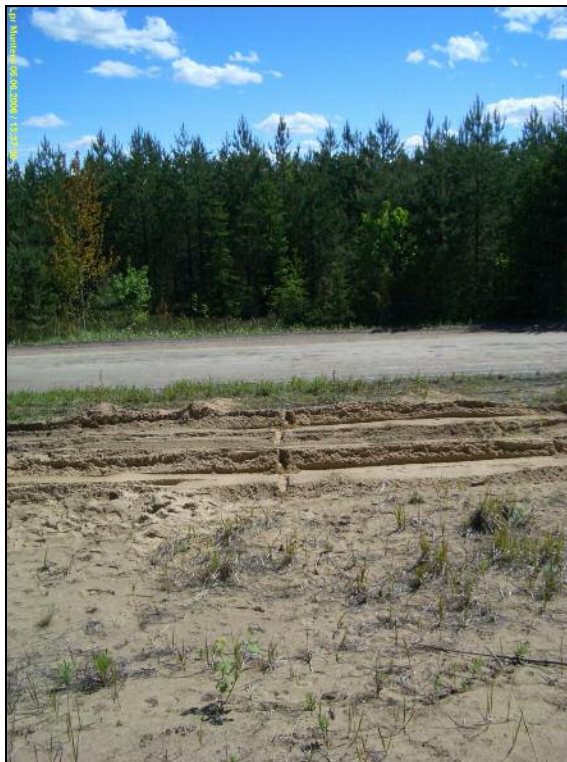
Kuvattu etelään Munterontien pohjoispuolelta. löytöpaikka on täältä kohden 16 m etelään tien eteläreunasta.