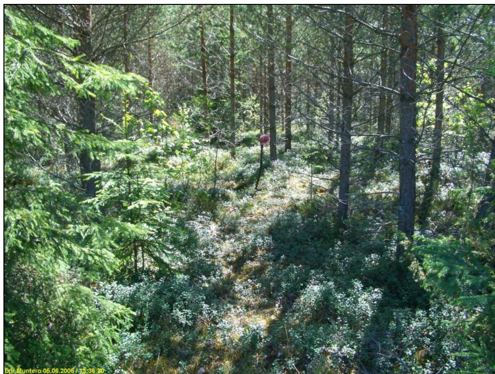
Löytökoekuoppa kuvan keskellä. Kuvattu etelään.