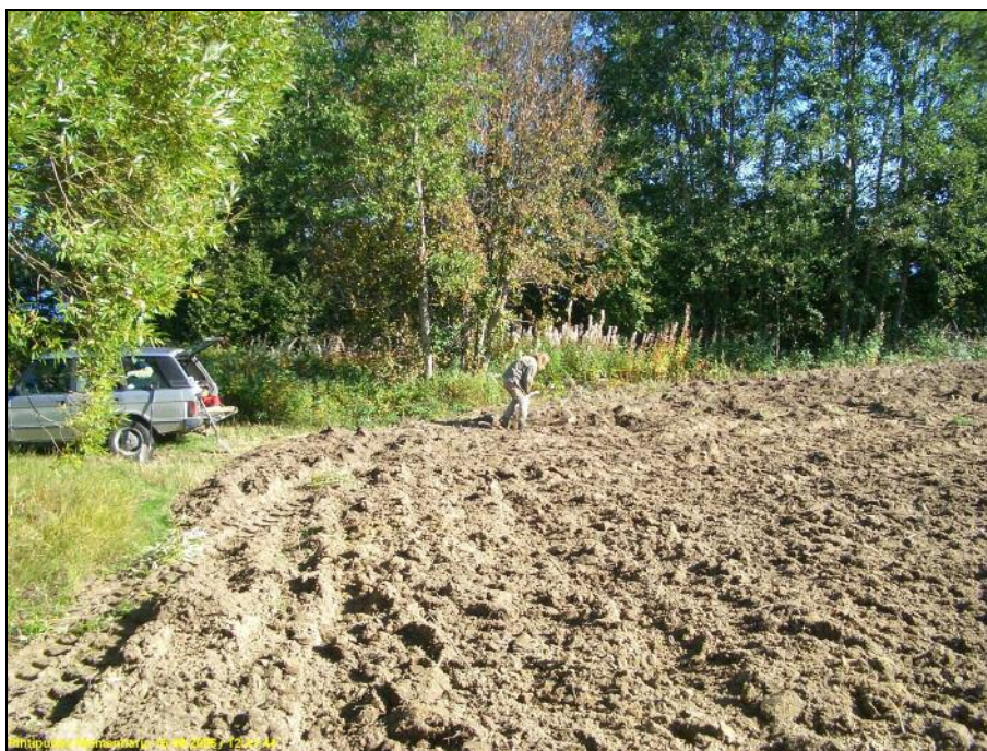
Koekuopitusta pellon reunassa, aiemmin tunnetun asuinpaikan liepeellä, joka sijaitsee pellon takana rantavitakossa.