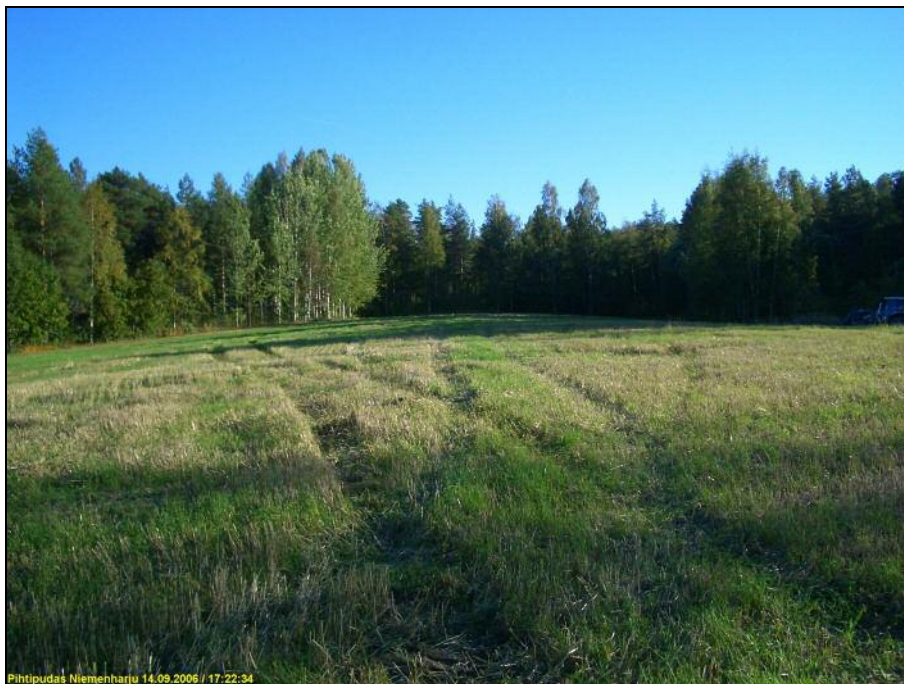
Pellon eteläosa ennen kyntämistä, kuvattu etelään