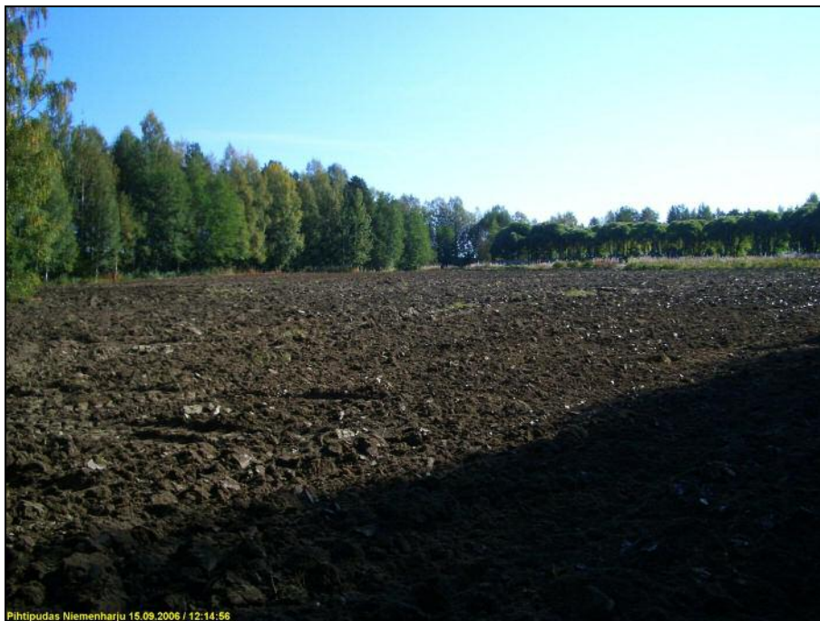
Pellon pohjoisosa, kuvattuna sen pohjoispäästä etelään.