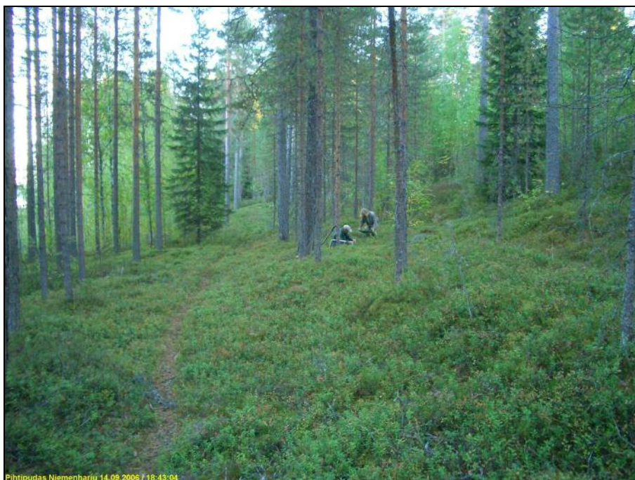
Alueen eteläosan länsireunaa kosteikon länsipuolella harjun juurella. Alueella ei havaittu mitään esihistoriaan viittaavaa.