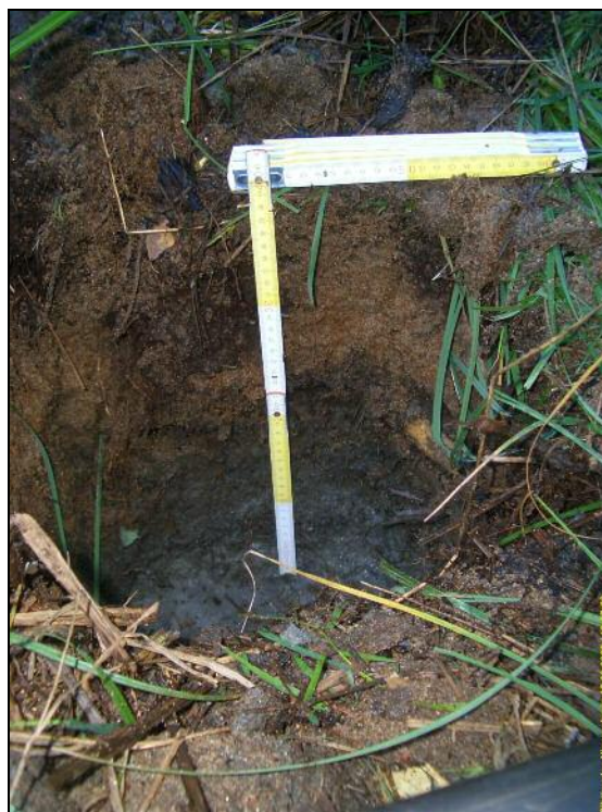
Koekuoppa rantavitakossa, aiemmin tunnetun asuinpaikan liepeillä. Kuopassa näkyy selvästi liejukerroksen päällä oleva hiekkakerros, joka on peräisin rantavitakon reunassa olevalta matalta rantatörmältä, joka on aikojen kuluessa sortunut järven rantaveteen. Nyt vesi oli hyvin alhaalla, mikä mahdollisti vitakon kuopittamisen.