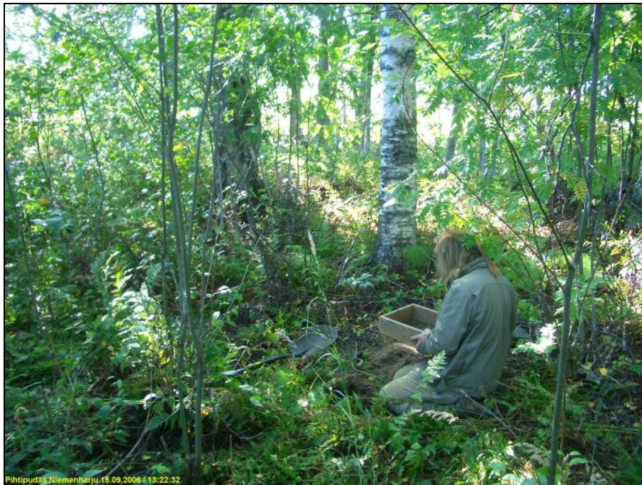
Koekuopan tutkimista rantavitakossa, edellisen kuvan tasalla.