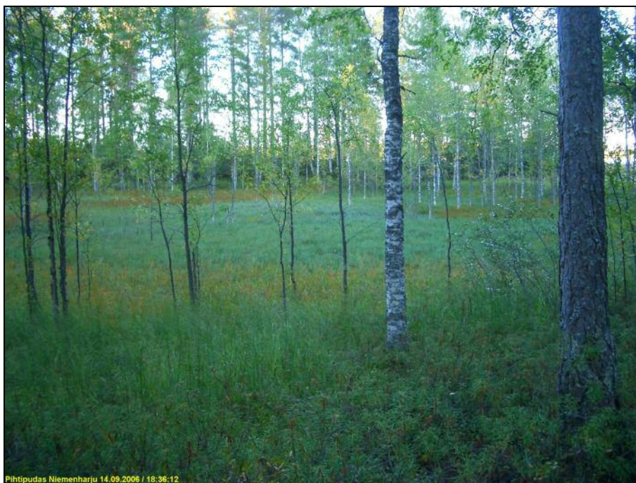
Kivikautinen asuinpaikka sijaitsee kosteikon takana olevassa kapeassa niemessä, kuvattu itään.