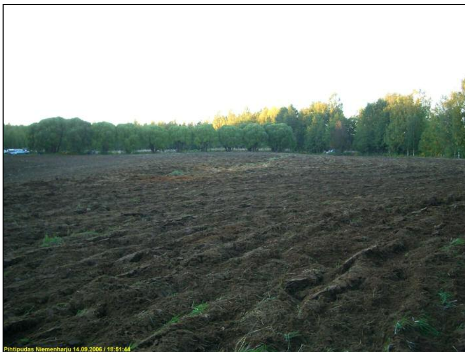
Pellon eteläosa kyntämisen jälkeen. kuvattu eteläpäästä pohjoiseen.